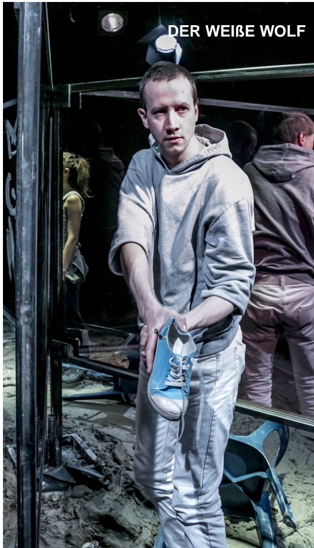
DER WEIßE WOLF