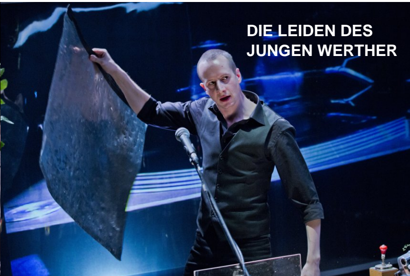
DIE LEIDEN DES JUNGEN WERTHER