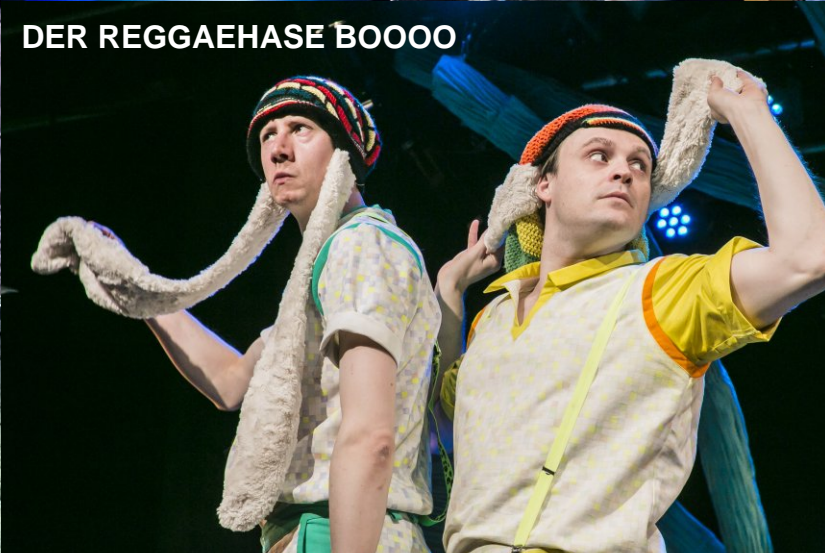
DER REGGAEHASE BOOOO